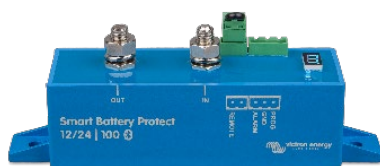
Smart BatteryProtect BP-100