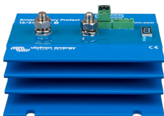
Smart BatteryProtect BP-220