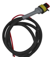
Cavo di controllo per Cyrix 12/24-230 Lunghezza: 1 m