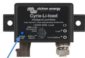
LED Indicatore di stato