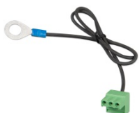
Connettore con cavo negativo CC pre-assemblato (incluso)